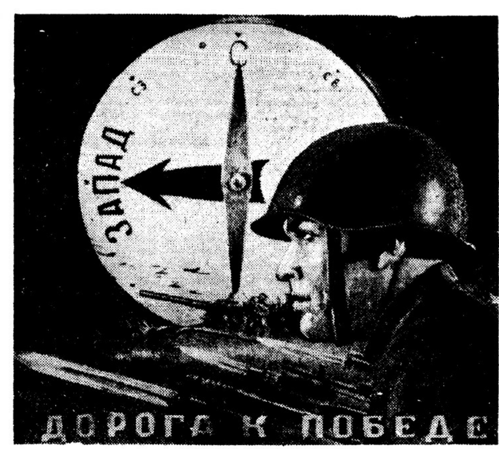
Иллюстрация В. КОРЕЦКОГО. Издательство «Искусство».

Как в столице республики Дауджанку, так и в районных центрах южные зрители горячо принимают спектакли двух кукольных театров, которые на осетинском и русском языках показывают пьесы «По шуму, ому велью», «Аленка и гусенок», «Пешка и кошки», «Красная шапочка» и др.